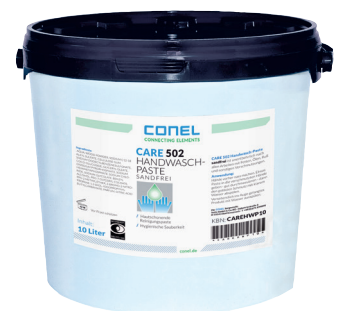
CARE 502 HAND-WASCHPASTE 10 LITER EIMER REIBEKÖRPER SANDFREI CONEL