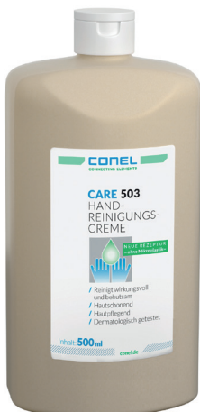
CARE 503 HAND-REINIGUNGS-CREME 500ML DOSE HAUTSCHONEND UND -PFLEGENDE CONEL