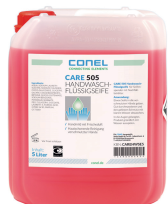
CARE 505 HAND-WASCH-FLÜSSIGSEIFE 5 LITER KANISTER HAUTMILD CONEL