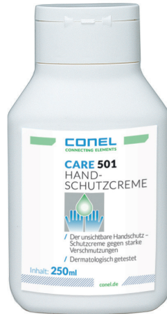
CARE 501 HAND-SCHUTZCREME 250ML QUETSCH. „UNSICHTBARER HANDSCHUH“ CONEL