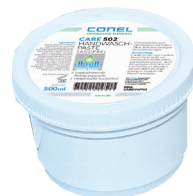
CARE 502 HAND-WASCHPASTE 500ML DOSE REIBEKÖRPER SANDFREI CONEL