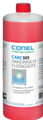
CARE 505 HAND-WASCH-FLÜSSIGSEIFE 1 LITER FLASCHE HAUTMILD CONEL