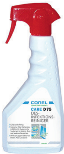
CARE DESINFEKTIONSREINIGER 500ML HANDSPRAYFLASCHE GEBRAUCHSFERTIG CONEL