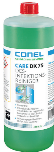
CARE DK 75 DESINFEKTIONS-REINIGER 1 LITER FLASCHE KONZENTRAT CONEL