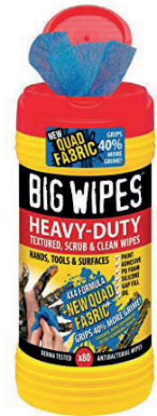
BIG WIPES HEAVY DUTY IN DER DOSE 100 STÜCK