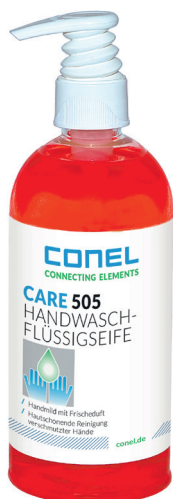
CARE 505 HAND-WASCH-FLÜSSIGSEIFE 500ML DOSIERSPENDERFLASCHE HAUTMILD CONEL