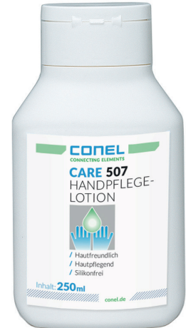
CARE 507 HANDPFLEGELOTION 250ML QUETSCH. FÜR BEANSPRUCHTE HAUT SILIKONFREI CONEL